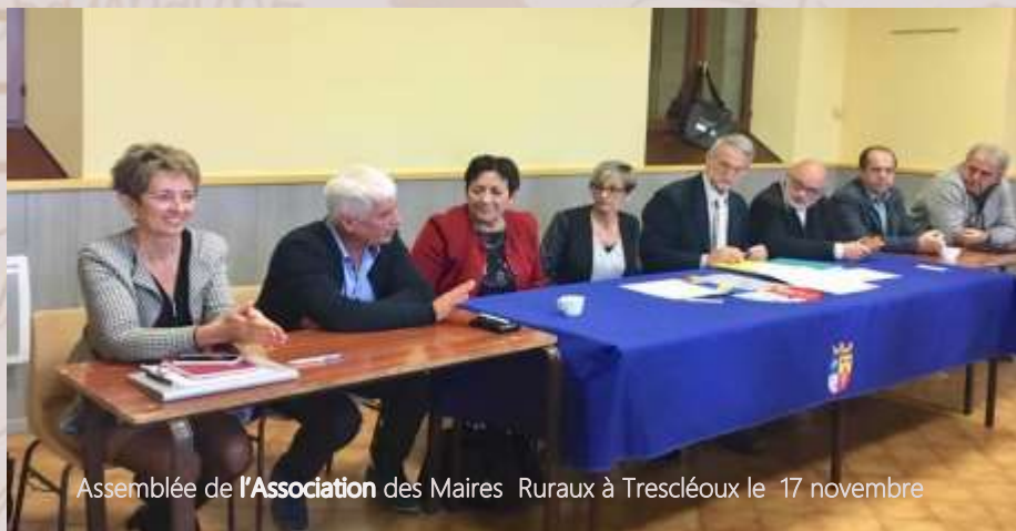
Assemblée de l'Association des Maires Ruraux à Trescléoux le 17 novembre

Et oui, Noël c'est dans quelques jours... l'année se termine à toute vitesse (même si nous devons rouler moins vite et éviter les encombrements dans les ronds-points) et je vous souhaite à tous de passer des très belles fêtes de fin d'année. Le conseil municipal, le personnel communal et moi-même, comptons sur votre présence le 19 janvier 2019 pour la cérémonie des vœux.