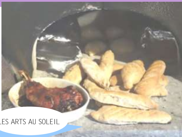
LES ARTS AU SOLEIL