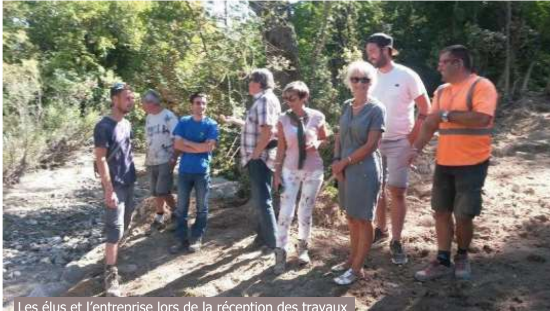
Les élus et l'entreprise lors de la réception des travaux

Les travaux de protection des canalisations d'alimentation en eau potable ainsi que l'effacement des seuils de la Blaisance sont achevés. L'Entreprise PISTONO de VEYNES a été retenue pour effectuer ce chantier qui a été réalisé à la fin de l'été.