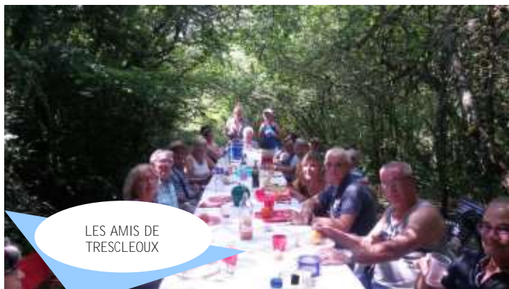
LES AMIS DE TRESCLEOUX

LES AMIS DE TRESCLEOUX ont organisé au mois d'août le buffet campagnard au stade du village. Une clôture a été posée pour protéger le verger (essentiellement de pruniers « Perdrigone »). Le drapeau a été re-fixé au niveau de la table d'orientation. Courant août une expo sur le Bénin, a eu lieu à la salle de la Petite Eglise durant une semaine. « Les Pistoliers » ont participé aux journées du patrimoine en présentant les Pistoles. Le traditionnel ramassage des Perdrigones a permis de préparer les fameuses pistoles qui ont été emportées sur le marché aux fruits anciens d'Orpierre.