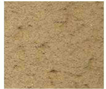
T70 - Terre beige