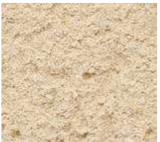
O50 – Beige rose