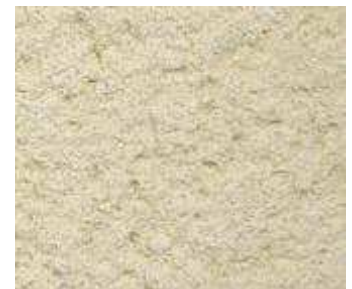
O30 – Beige orange