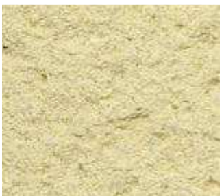
J40 – Sable jaune