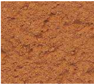
O90 – Brique naturelle