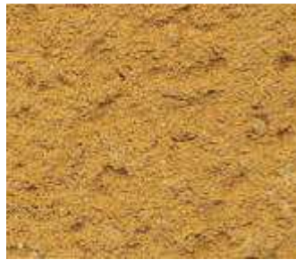
O80 – Terre orange