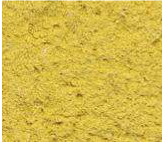
J70 – Jaune ocre