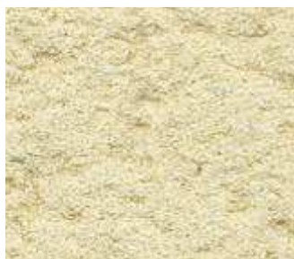
O10 – Sable