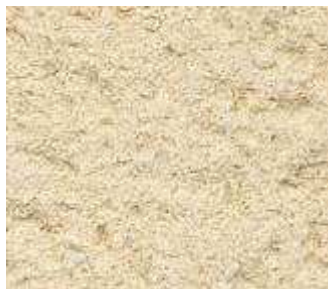
R20 – Sable rose