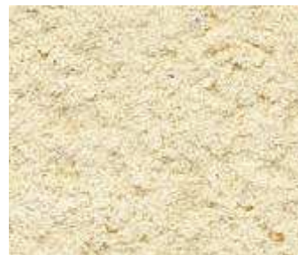
T20 – Sable clair