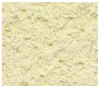
J20 – Jaune pale