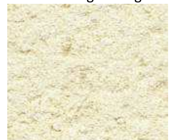
G20 – Blanc cassé