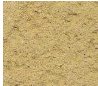
O70 - Ocre clair