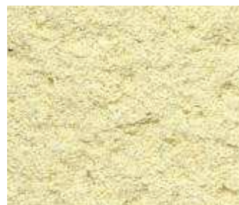
J39 – Sable athènes