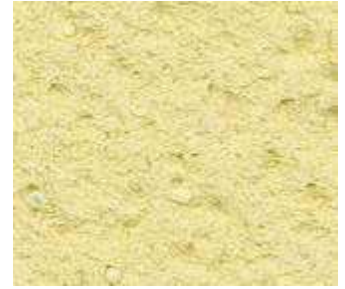
J30 – Jaune opale