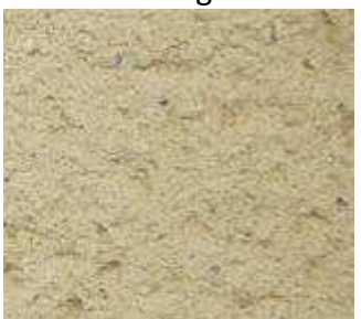
T50 – Terre de sable