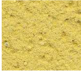
J60 – Jaune pollen