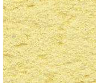
J50 – Jaune paille