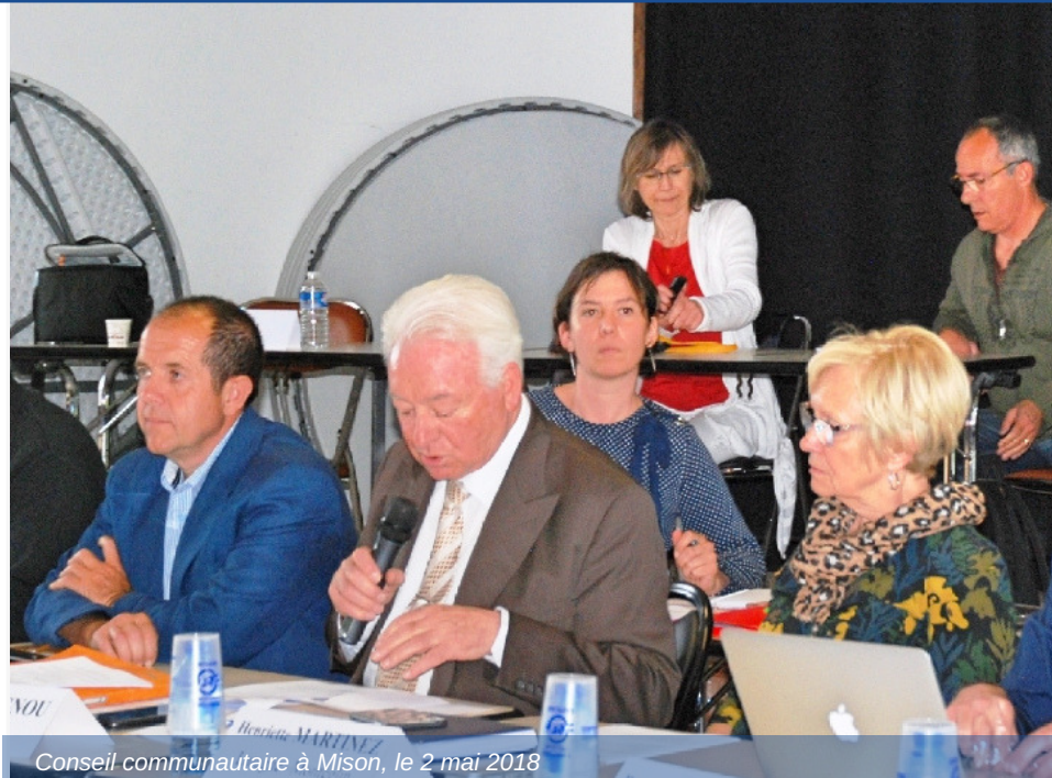
Conseil communautaire à Mison, le 2 mai 2018