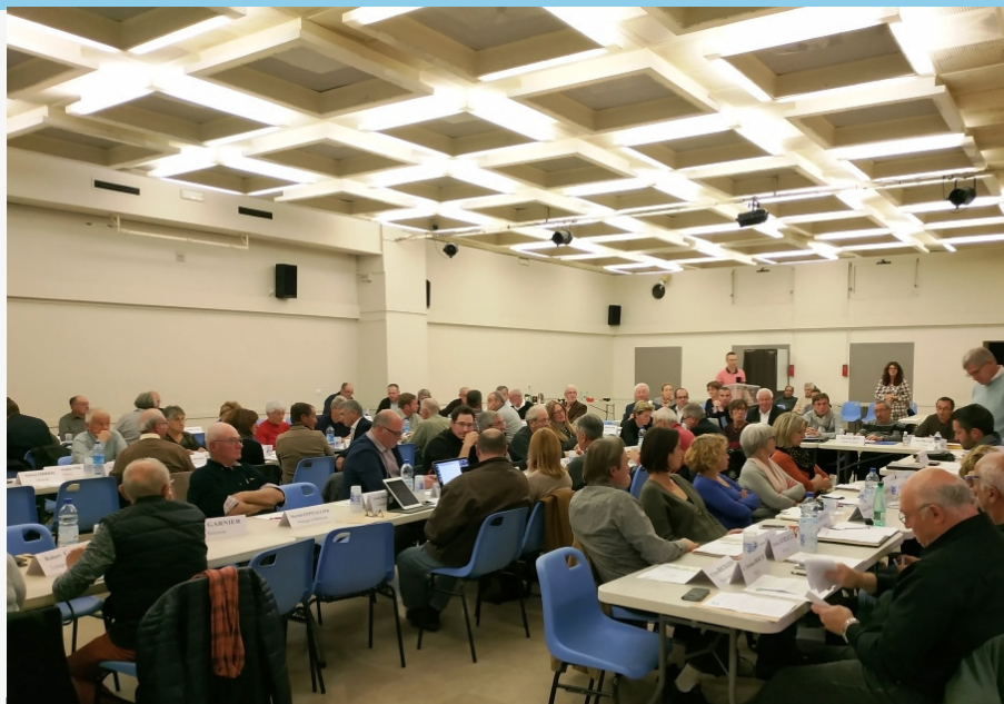
Conseil communautaire à Laragne, le 30 octobre 2018